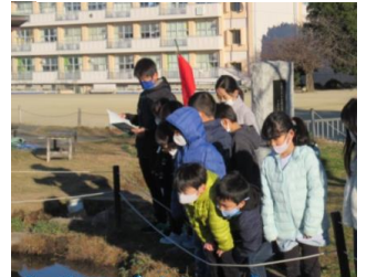
1年生に「ビオトープツアー」を行いました！