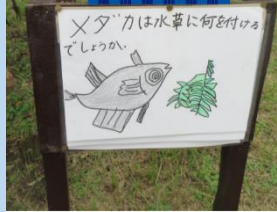
低学年も楽しめるクイズの看板を作りました。