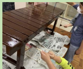
ベンチを作って、みんなが休めるようにしました。