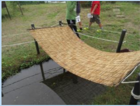
メダカが休めるように、池にすだれを設置しました。