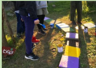
ブロックに色をぬって、道をわかりやすくしました。