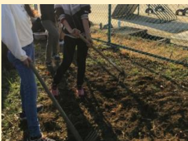
花や木を植えて、道をはなやかにしました。