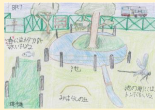
パンフレットを作ってバス停、に置いてもらう計画をしました。