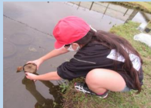
水草を増やしました。