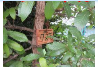
木に看板を設置しました。