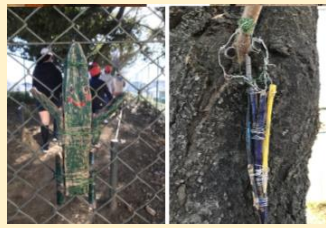
落ちていた木や枝を使ってキャラクターを作って飾りました。