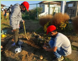
花を増やしました。